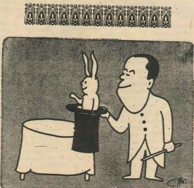
Αναμείνεται έκπληξεις από τόν κ. Μαρκαζίνη Τού Χ. Άνωγειωτόπουλου

Ένυπόγραφες συνεργασίες δέν εκφράζουν κατ' ανάγκη άπόψεις τής Σ.Ν.—ΕΔΕΝ.